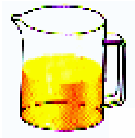
\frac{1}{2} l Apfelsaft

DIE HÄLFTE DES KIRSCHAFTES WIRD IN DEN KRUG MIT APFELSAFT UMGEFÜLLT. DANN WIRD GUT DURCHGEMISCHT. ANSCHLIEßEND WIRD EIN DRITTEL IN DEN KRUG MIT DEM KIRSCHAFT ZURÜCKGEGOSSEN