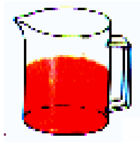
\frac{1}{2} l Kirschsft

IST JETZT MEHR APFELSAFT IM KIRSCHAFTKRUG ODER MEHR KIRSCHAFT IM APFELSAFTKRUG ?????